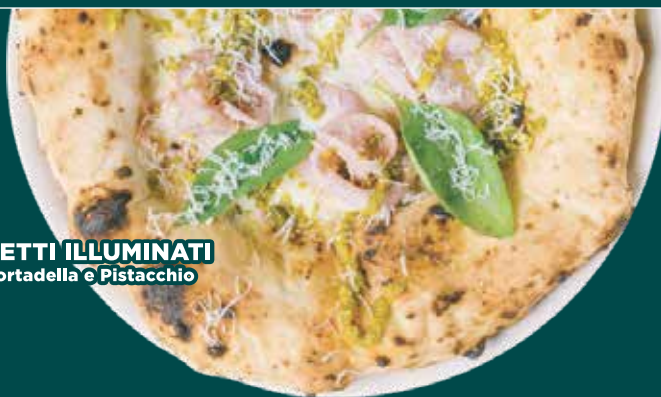
LA TETTI ILLUMINATI con Mortadella e Pistacchio

Pomodorino cotto a bassa temperatura, Fiordilatte dei Monti, melanzane a funghetto. In uscita: Cuore di Burrata, olio e basilico